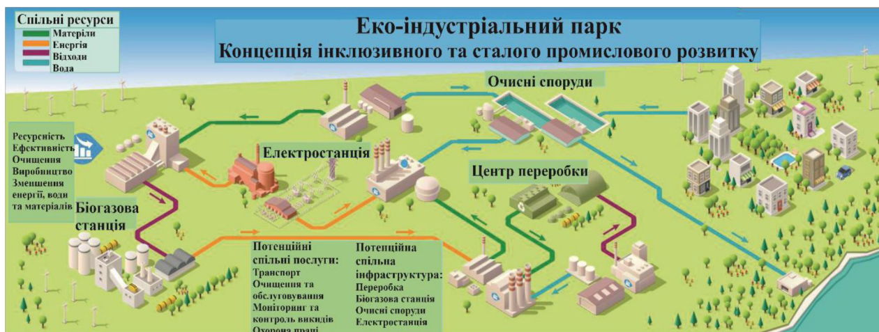
Рис. 1. Концепція екоіндустріального парку (Міжнародні ..., 2021)