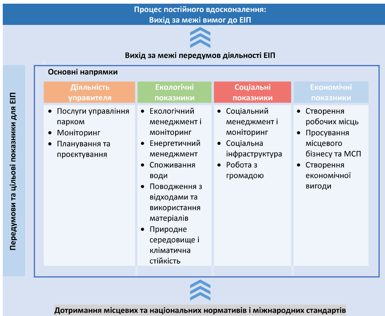
Рис. 2. Загальна схема опису екоіндустріальних парків за матеріалами (Міжнародні ..., 2021)