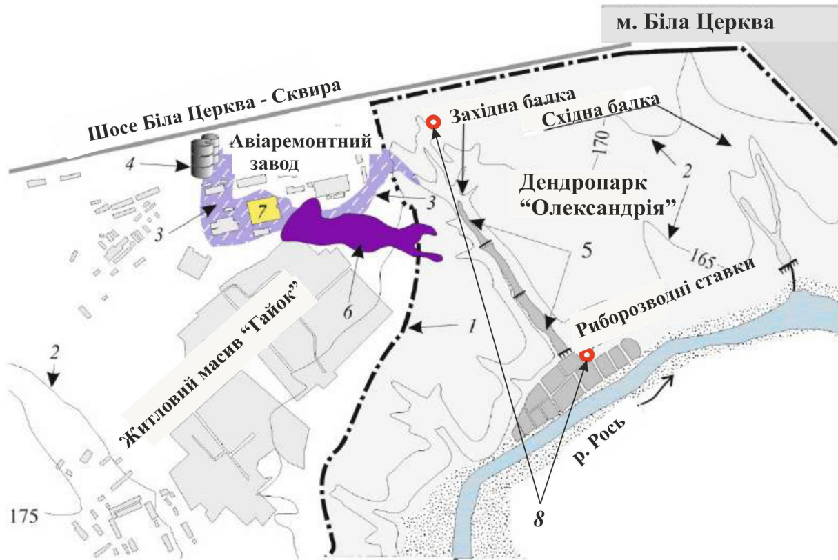
Рис. 3. Оглядова схема території досліджень за Bricks et al. (2020), з оновленнями: 1 — межа території дендропарку; 2 — лінії гідроізогіпс; 3 — зона забруднення геологічного середовища нафтопродуктами (за даними Правобережної геологічної експедиції, 1990 р.); 4 — склад паливно-мастильних матеріалів; 5 — каскад штучних ставків (Потерчате, Русалка і Водяник); 6 — шар мобільних нафтопродуктів (за даними Інституту геологічних наук НАН України, 2007 р.); 7 — авіаремонтна майстерня — джерело забруднення ґрунтових вод; 8 — свердловини, рекомендовані до включення в Державну систему моніторингу підземних вод України (за даними Інституту геологічних наук НАН України, 2021 р.).