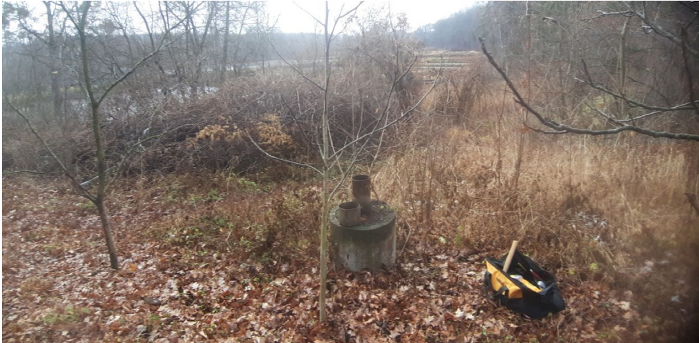
Рис. 5. Свердловина в низовині урочища Потерчате (на правому схилі), яку рекомендовано включити до Державної моніторингової мережі.