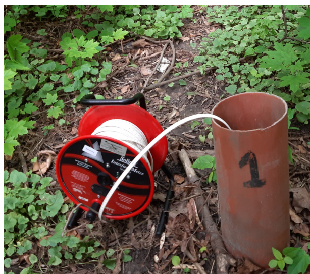
Рис. 4. Буріння спостережних свердловин і заміри рівнів ґрунтових вод і нафтопродуктів.