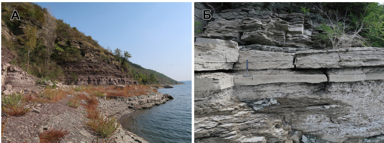
Рис. 4. Відслонення верхньої частини канилівської серії: А — староушицькі та кривчанські верстви на березі р. Дністер біля с. Пижівка; Б — поливанівські та комарівські верстви у берегових відслоненнях Дністра на південний схід від с. Гораївка.

Робоча група ІГН НАН України проводила роботи по ревізії стану раніше відомих відслонень і стратотипів протягом п'яти років. Отримано важливу інформацію про стан найважливіших об'єктів