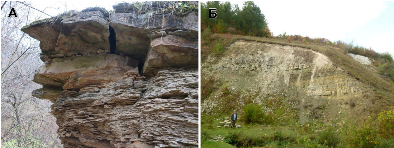
Рис. 1. Відслонення могилівської світи: А — ломозівські та ямпільські верстви на стратотипі ломозівських верств у с. Ломазів; Б — фрагмент відслонення Борщів Яр у м. Могилів-Подільський: бернашівські та бронницькі верстви.