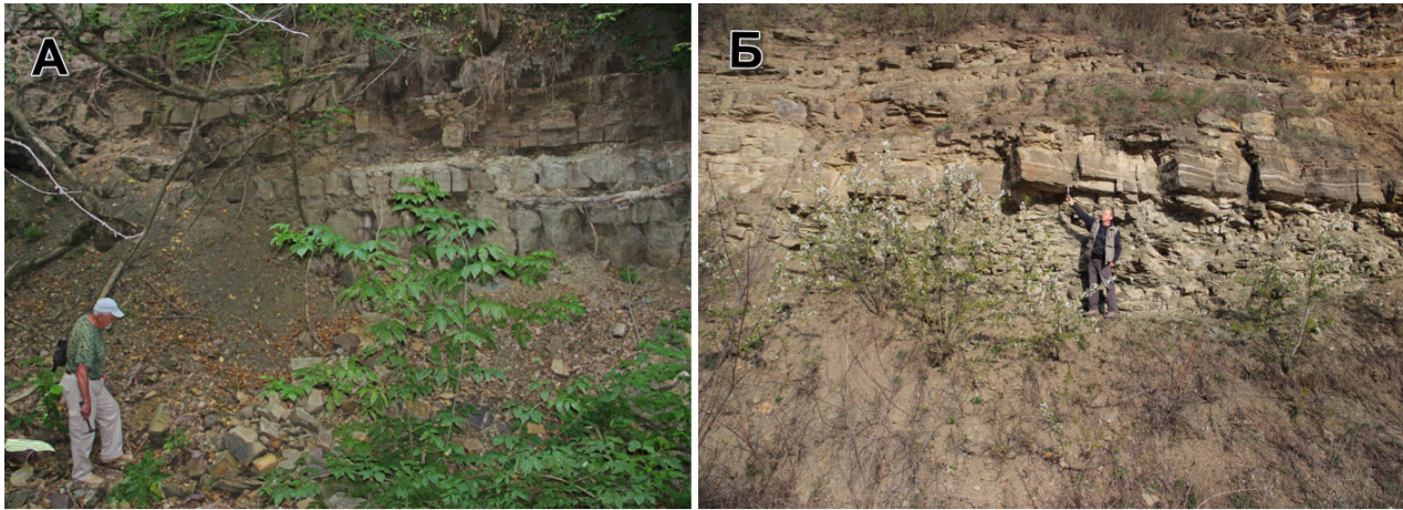
Рис. 2. Відслонення нагорянської світи: А — бернашівські та бронницькі верстви в яру у с. Бернашівка; Б — зінківські та джуржівські верстви біля с. Липчани.