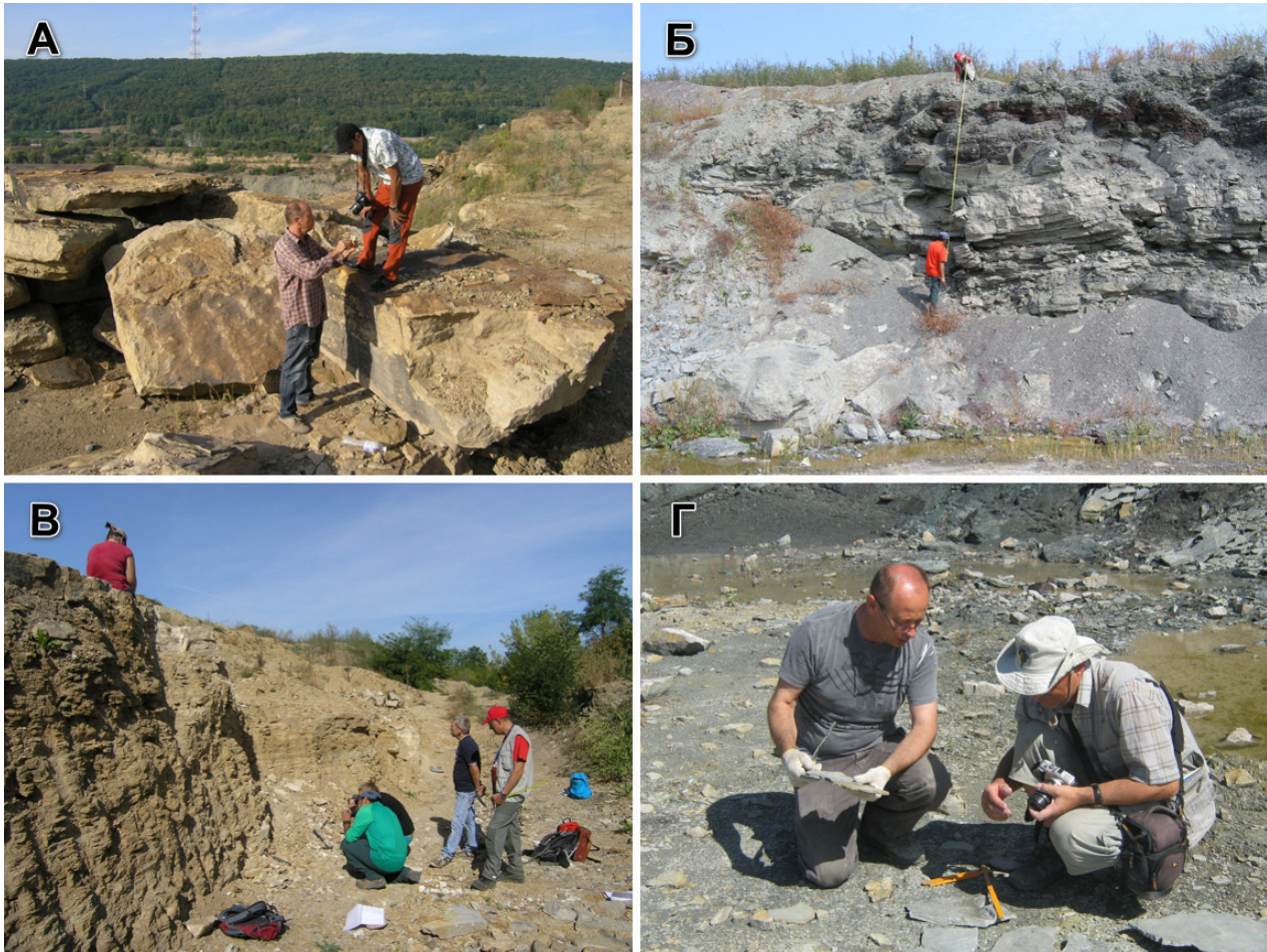
Рис. 6. Польові дослідження відкладів могилів-подільської серії: А — дослідження біоти бернашівських верств із скам'янілостями намібійського типу спільно з Abderrazak El Albani (Université de Poitiers); Б — Abderrazak El Albani з асистентом досліджують межу між ямпільськими та лядівськими верствами; В — літолого-геохімічні та палеонтологічні дослідження пісковика ямпільських верств; Г — дослідження іхрофосилій з ямпільських верств разом з Alfred Uchman ( Instytut Nauk Geologicznych UJ ).

Fig. 6. Field studies of deposits of the Mohyliv-Podilskiy Group: A — studies of the biota of the Bernashiv layers with fossils of the Namibian type together with Abderrazak El Albani (University of Poitiers); Б — Abderrazak El Albani and his assistant investigate the boundary between the Yampil and Lyadova members; В — lithological-geochemical and paleontological studies of the sandstone of the Yampil Member; Г — studies of ichnofossils from the Yampil Member with Alfred Uchman (Institute of Geological Sciences, UJ).