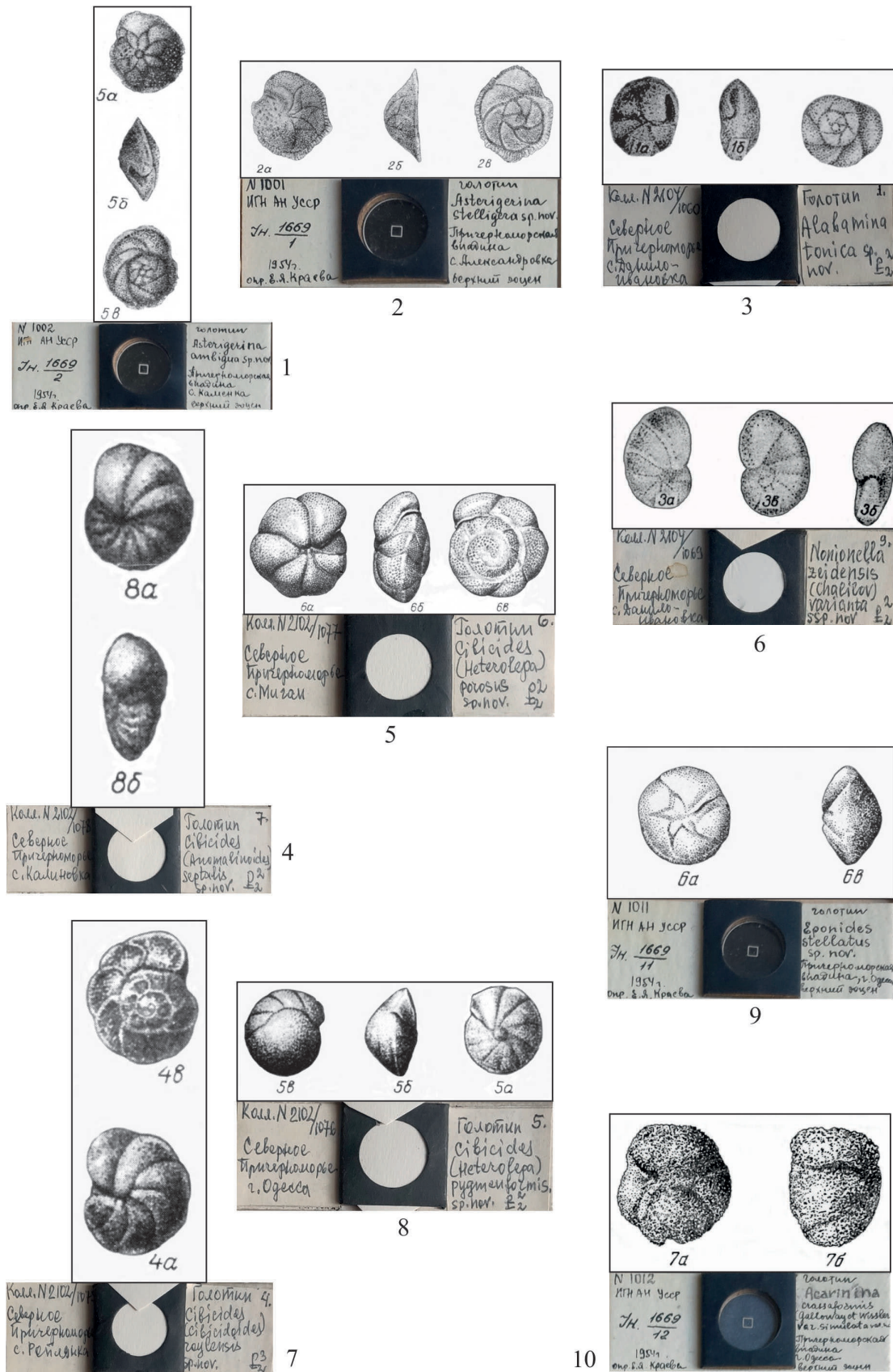
Рис. 3. Голотини форамініфер, за Є. Я. Краєвою: 1 – Asterigerina ambigua Krajeva (Краєва, 1958), голотип № 1002; 2 – Asterigerina stelligera Krajeva (Краєва, 1958), голотип № 1001; 3 – Alabama tonica Krajeva (Краєва, 1972), голотип № 1060; 4 – Cibicides (Anomalinoidea) septalis Krajeva (Краєва, 1970), голотип № 1078; 5 – Cibicides (Heterolepa) porosus Krajeva