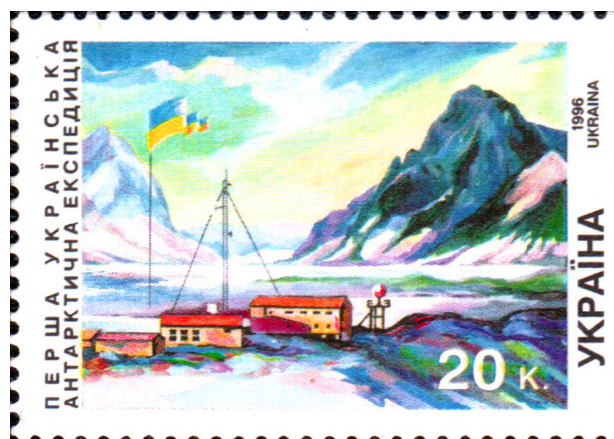
Рис. 6. Пам'ятна поштова марка, видана на честь Першої української антарктичної експедиції.