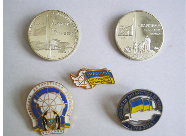
Рис. 7. Ювілейна монета, медалі та значки учасників українських антарктичних експедицій.

— Украина в Антарктиде (Антарктика—в сфере деятельности украинских ученых): материалы