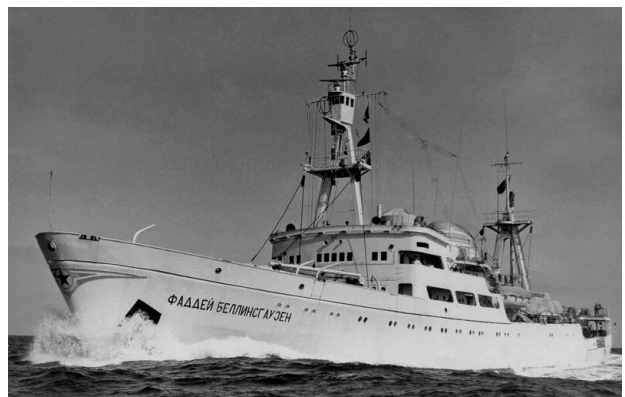
Рис. 2. ОДС «Фаддей Беллінсгаузен» здійснив навколосвітнє плавання у 1982–1983 рр.