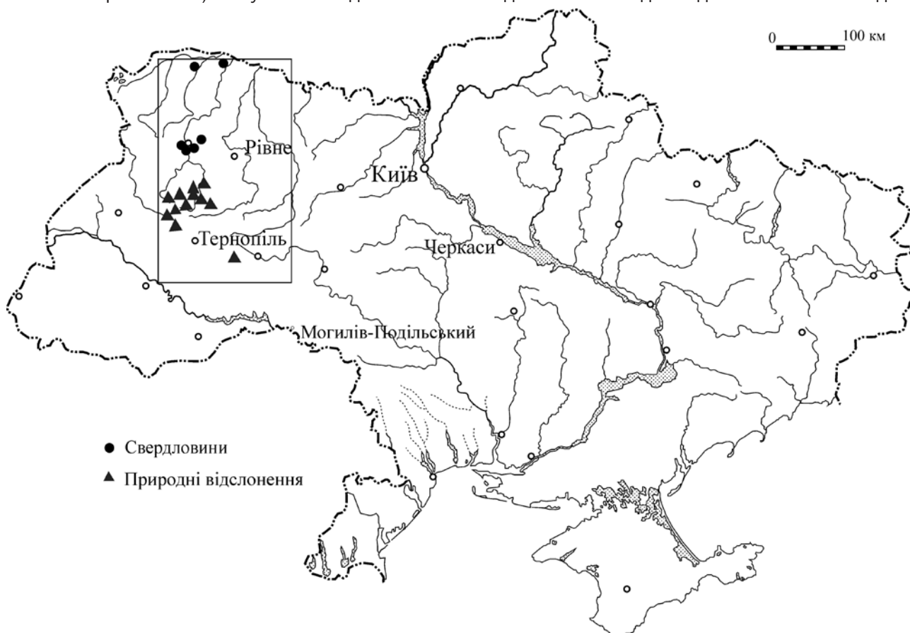
Рисунок. Карта фактичного матеріалу

Аналіз палінокомплексів з альбських відкладів Волино-Поділля дозволив скласти дея-