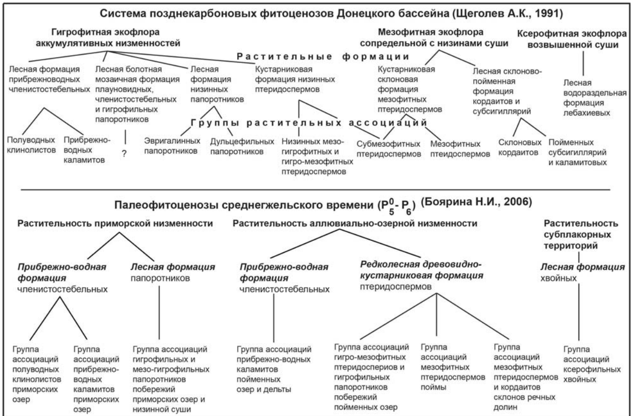
Рис. 1. Классификации позднекаменноугольных фитоценозов Донецкого бассейна с использованием доминантного и физиономического подходов к классификации растительности