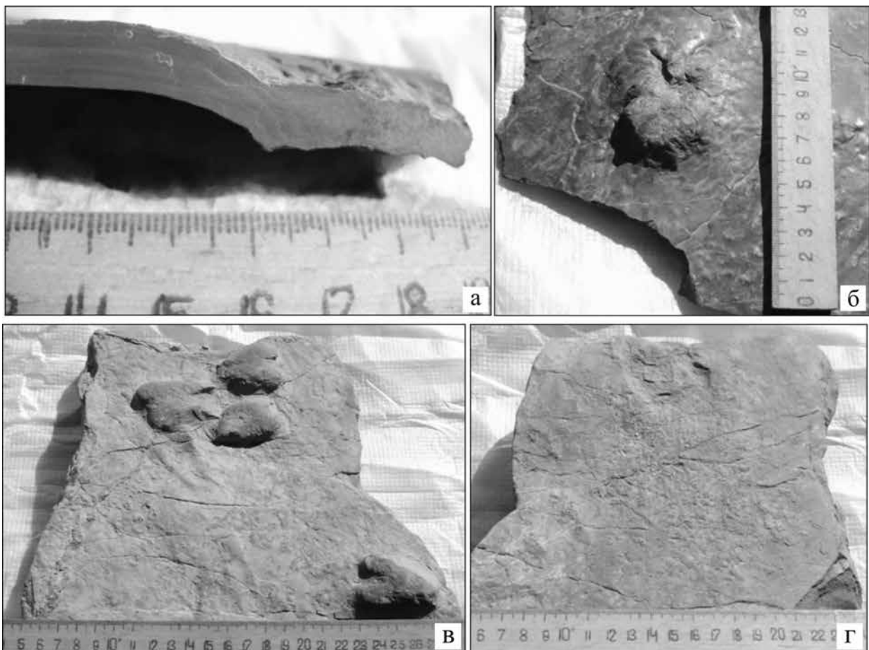
Рис. 1. Характер деформації осадів

Із зразків, відібраних в полі з корінних відслонень, зроблено ряд паралельних зрізів і виготовлено три шліфи і один аншліф. Наприклад, зразок відібраний по р. Лючка в Яблуніві представляє собою тонкокристалічний вапняк з домішкою глинистих мінералів, куластих уламків кварцу та мусковіту. Розподіл кластичного матеріалу спостерігається по окремих напрямках мікросхаруватості, а лейсти мусковіту підкреслюють хаотичний характер переміщення у відкладеній масі. Через весь шліф під кутом до покрівлі масу породи перетинає смужка дрібних зерен халькозину, що складається з чотирьох-пяти тонших.