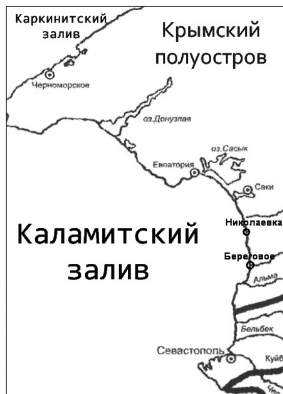
Рис. 1. Схема береговой зоны западного побережья Крыма

зоны между населенными пунктами Береговое и Николаевка. Здесь воды Каламитского залива врезаются вглубь Крымского полуострова на 15 км (рис. 1). Максимальная глубина составляет 30 м, ширина у входа 41 км. С территории полуострова в залив впадают реки Альма, Бельбек, Кача и Западный Булганак.